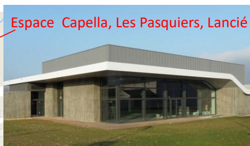
Espace Capella, Les Pasquiers, Lancié